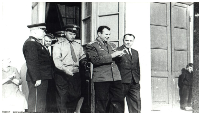
В Сещинском гарнизоне. Сеща, Дубровский район, 25 мая 1966 года.