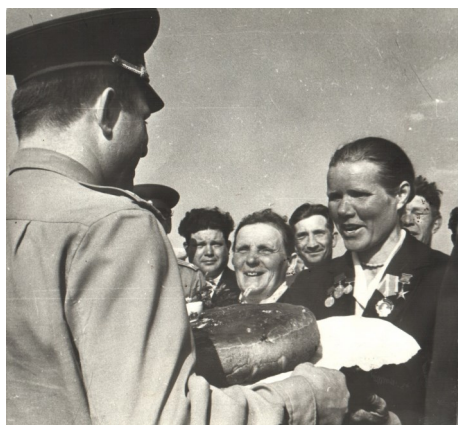
Встреча героя космоса. Сеща, Дубровский район, 25 мая 1966 год.